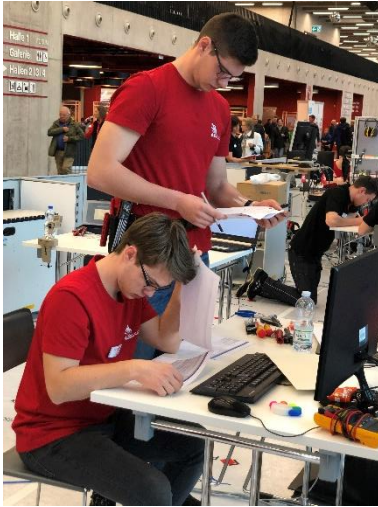
Erstes Studieren der Aufgaben

zu 100% erfüllt ist). Die Experten hatten die Aufgabe der Bewertung nach jedem Task, wie bei Worldskills üblich – inkl. Verwendung von iPads für die Bewertungen von Judgement.